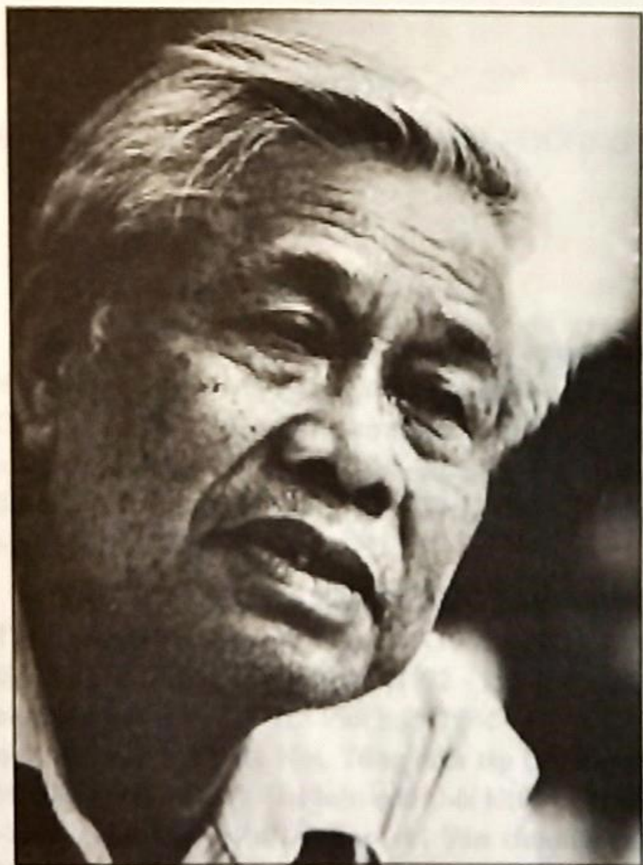
Nhà thơ VŨ QUẦN PHƯƠNG